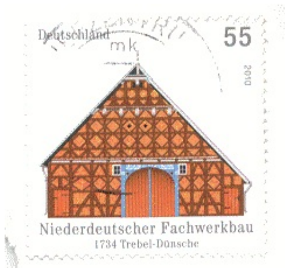
Bild: aus der Briefmarkenserie Fachwerkhäuser