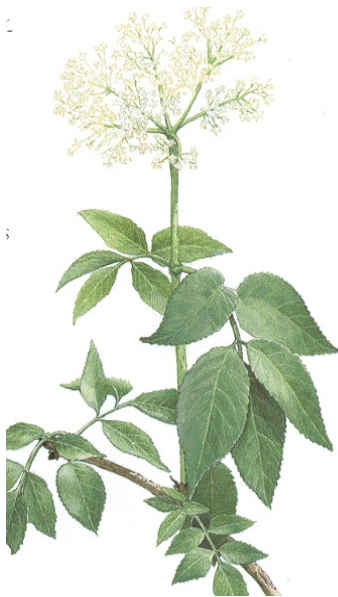
Schwarzer Holunder

Eine ganze Reihe von Kräutern wird in dem Buch aufgezählt, die neben dem Donner- kraut vor Blitz und Donner schützen sollen. So ist von Hauslauch oder Hauswurz die