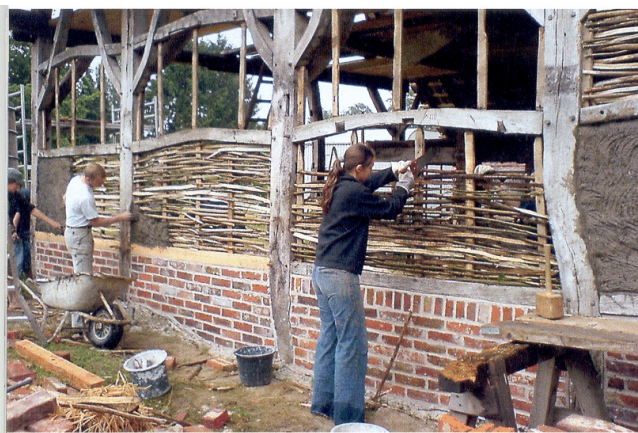
Fachwerk-Seminar der Jugendbauhütte Duisburg-Raesfeld in Raesfeld

sich nur noch mit Resten begnügen kann. Hinzu kommt, daß die meisten Erbauer oft an den Nebengebäuden sparen mußten, d. h.